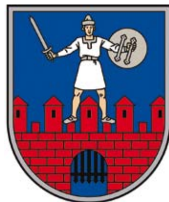
Attēlā: Apstiprinātais Cēsu novada ģerbonis.